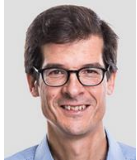
Zürcher Hochschule für Angewandte Wissenschaften